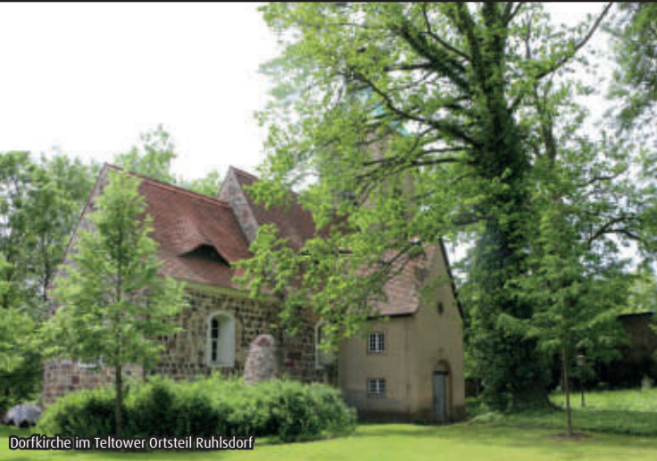
Dorfkirche im Teltower Ortsteil Ruhlsdorf