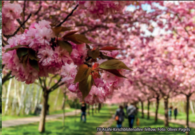
TV-Asahi-Kirschblütenallee Teltow